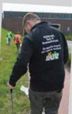
Zondag 19 april is er terug een grote lenteschoonmaak in ons dorp!